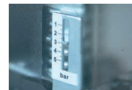
SG (ГРАДУИРОВАННАЯ ШКАЛА)